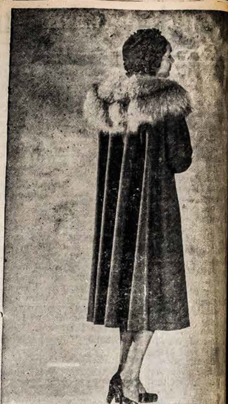
PRABANGŲ ŠVARKAI SUGRĮŽTA, KADA TAI UŽSIBAIGIA

Prabangūs kailiu papuošti švarkai sugrįžta su užsibaigia dvidešimtis nuosimčių taksos už kaidimais šis ploščius su plaučiu sidabrinės lapės kalnierių šioje vietoje.