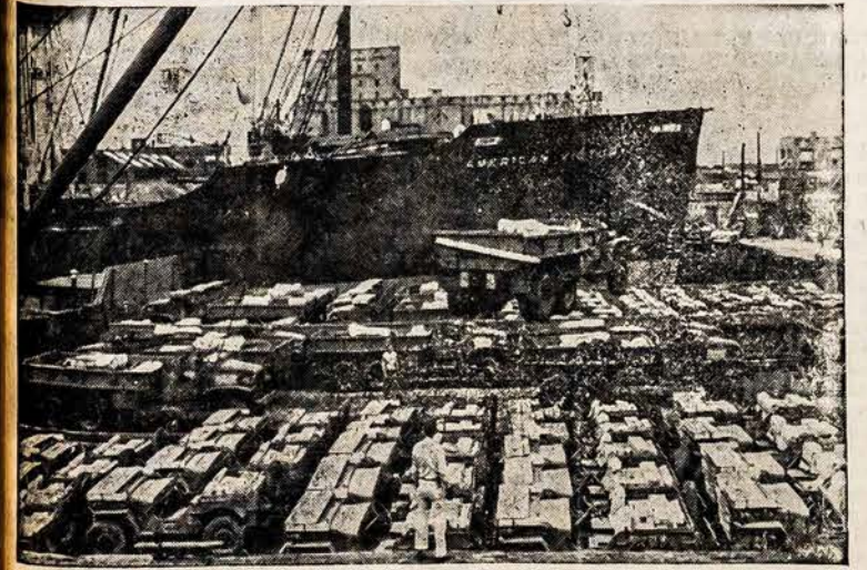
SUNKVEŽIMIAI GRAIKIJAI NEW YORK. — Vaizdas New Yorko uoste, kada krauna "American Victory" laivą su vežimais ir kitais vežimais ir medžiagomis Graikijai. Laivas išplaukė tuo laiku, kada jos vyriausybė praneša apie išlaukinės brigados užpuolimus ant jos žemės.

Išleido Lietuvai Vaduoti Sąjunga TOMAS 1-MAS Parašė AUDRUNAS ir SVYRIUS, 1946 m. su Lietuvos žemėlapių ir 12 iliustracijų 312 puslapių — Kaina $3.00 Pinigus ar čekius siųskite šiuo adresu — AMERIKOS LIETUVIS 14 Vernon Street Worcester, Mass.