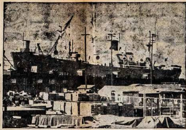
PRIEŽASTIS ILGESNIO GASOLINO TRUKUMO SAN PEDRO, CALIF. — Rodomas viršų sovietų krovinius laivas "Maikop", vienas iš laivyno, čia atplaukė prisikrauti tukstancius aliejaus ir gasolino staines pristatymui Rusijai, tuo laiku, kada Suvienytas Valstijas laukia naftos produktų trukumas.

Gruodžio mėn. Clevelande lankėsi senatorius Taft, vadas republikonų partijos senate. Čia teko dalyvauti Hotel Statler ir turėti apie valandą laiko pasikalbėjimui kas link pabėgėlių, prispaustų tautų ir ypatingai apie Lietuvą. Jo pareiškimas tada buvo, kad jis rėms visais būdais, kad surasti galimybes įsileisti daugiau pabė-