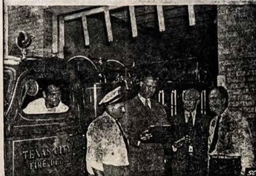
TEXAS MIESTAS GAUNA NAUJĄ MIGLOS UGNIES KOVOTOJĄ