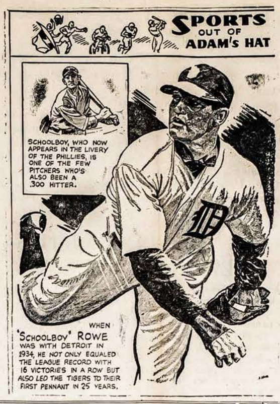
SCHOOLBOY WHO NOW APPEARS IN THE LIVERY OF THE PHILLIES, IS ONE OF THE FEW PITCHERS WHO'S ALSO BEEN A .300 HITTER.