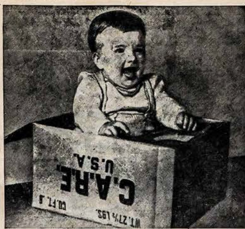
tijoj (amerikiečių, britų ir Uždarymas pasiskite prancūzų zonose ir visame CARE, 50 Broad St., New York 4, N.Y. Berlin) ir Airijoj.