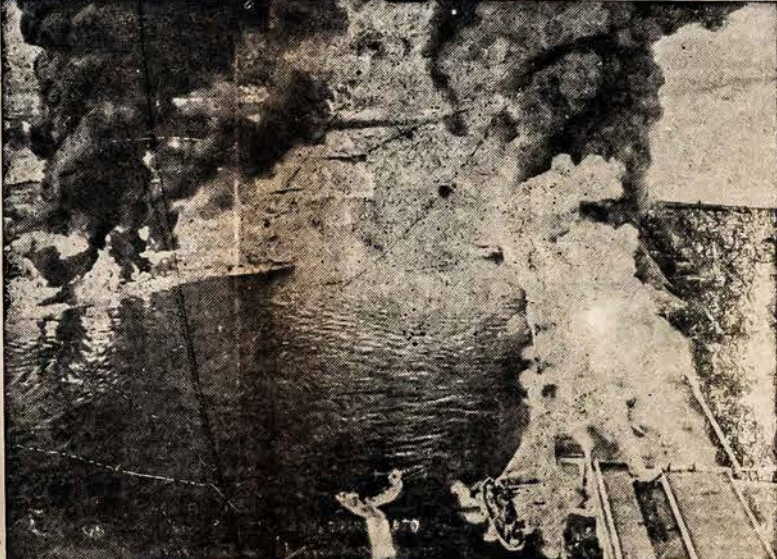
KITAS NETIKĖTAS SPROGIMAS LOS ANGELES. — Sprogimas panašus į plyšimą kurs pradėjo terorą Texas Mieste, pasu-po uostą, kur tankierius Markay sunkilo. Kairėje matyti kaip dega, gi dešinėje ugniagesių laivai bando gesinti liepsnojančias sankrovas.

Amerikos žydai nori sukolektuoti 170 milijonų naujame vajuje sušelpiti savo išvietintus tautiečius Europoje.