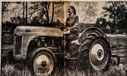
GERA ŽINIA UKININKAMS DETROIT. — Naujas Fordo traktorius palengvina ir pagreitina ukio darbus. Tokios mašinos kasdien po 400 užbaigiamos Fordo Highland Parko dirbtuvėje, Detroitė.