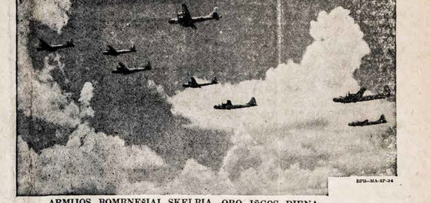
ARMIJOS BOMBESIAI SKELBIA ORO JĖGOS DIENĄ B-29 bombnešių skrajojantis formavimas rodo Suvienujų Valstijų Armijos Oro Jėgų pažangią dvasią. Oro Jėgos minės savo keturiasdešimt metų įsteigimo sukaktuves. Rugpjūčio 1-mą, oficialiskai paskirtą "Oro Jėgų Dieną," militariškai ir civiliskai bus pripažinta per visą kraštą, kad "Oro Jėga yra Taikos Jėga."