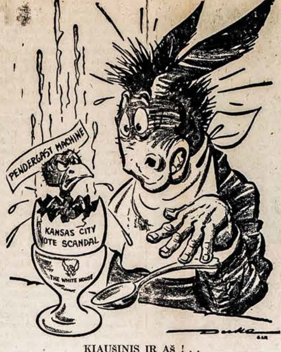
KIAUSINIS IR AŠ ! !

Šaukiama anglų, prancuzų ir rusų ministerių konferencija Paryžiu apsvartymui Marshallo ekonominės paramos plano vargiai duos geras pasekmes. Maskva nepriimsia ekonominių appeasementų, jeigu bus jai pastatytos sąlygos pakelti geležinės uždangos kortena, arba, jeigu reikalau Maskvą leisti Amerikai naudotis savo dovanų teikiama eksportu į Europos kraštus rusų valdomos. Kadangi Marshallo planas glaudžiai sujungiamas su labdarės ir ekonominiams išroka-vimais, kurie turi politiškus motyvus ir tikslus, todėl ne-