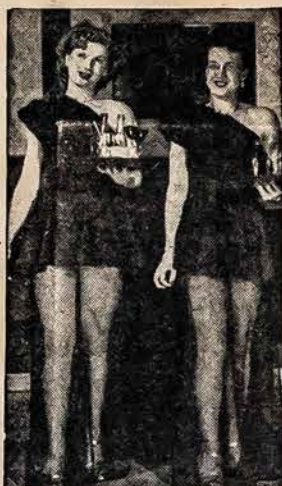
PATARNAUTOJOS New York. — Sheraton viešbučio patarnautojos juodoje suknelėse nešioja gėrymus.

Gydytojas turi būti labai švelnus, atsargus, neskubėti, išlaukti atitinkama laiką ir rasti momentą atitinkamam pareiškimui. Yra atsitikimų, kuomet sergant peritonitu, gazine flemona, sensis ar kitais susirgimais, ligoniui blogėjant, atsiranda euforija ir, nežiurint blogėjančios buklės, ligonis gydy-