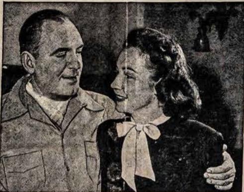
Vasaros žvaigždės—Pat O'Brien ir Lynn Bari tariasi apie naują dramatišką programą, kuri bus transliuojama per NBC, "The Rexall Summer Theater." Programa tęsis iki spalio 3-tią dieną