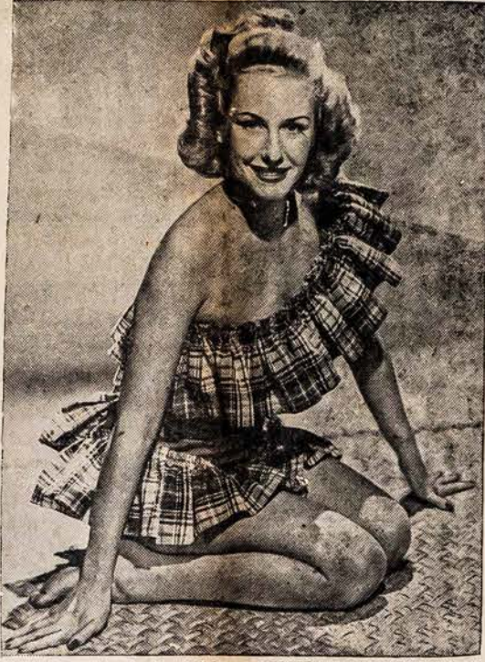
NBC naujausia žvaigždė — LUCILLE NORMAN, dainininkė dėvi vėliausios mados kostiumą — kurs buvo jai atsiustas iš Kalifornijos.