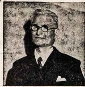
DR. KAZYS GRINIUS, BUVĖS LIETUVOS PREZIDENTAS

1) In violation of internatio- nal law, the Soviet authorities have drafted and are drafting the country's youth for milita- ry service, despite Lithuania's neutral status and the forcible nature of its incorporation in the Soviet Union. Furthermore, about 100,000 young people of both sexes, between fourteen and twenty years of age, were deported to the remote recesses of Russia for labor in the course of the one single year of 1945. The deportations were continued in 1946.