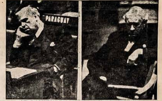
AR PASKENDE SUNKIOSE PROBLEMOSE? FLUSHING, N. Y. — Gal nepaprastai šilta diena, sykiu su monotoniška Suvienujų Tautų Generalio Susirinkimo liga su- vargino Dr. Francisco Castillo Najera (kairėje), Meksikos atsto- vybės pirmininką, ir senatorių Tom Conally (dešinėje) demokra- tas, nuo Texas valstijos, Suv. Valstijų atstovą.

Tad kiek nors tas spragas užkišti, mūsų Našlaičių Fon- das nutarė imtis globoti ne- tik našlaičius, bet visus vai- kus. Ypatingai norime gel- bėti paliegiams vaikams ir priešmokyklinio amžiaus