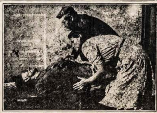
NE LAISVĖ, BET MIRTIS IR DARBININKAMS

santykius? Suvienytų Valstijų pareiškime pažymėta: "Raportai priimti iš Suvienytų Valstijų pasiuntinybės Lenkijoje, kaip tik prieš rinkimus, ir po rinkimų įrodė šiai vyriausybei, kad buvo prievarta ir įbauginimas prieš demokratiškus elementus, kurie buvo ištikimi Lenkijai. Suvienytos Valstijos nenori kištis į Lenkijos vidujinius reikalus. Suvienytos Valstijos sykiu su Britų ir Sovietų vyriausybėms apsiėmė suteikti ilgai kenčiantiems Lenkijos žmonėms progą išsirinkti savo valdžią. Delto, šioji vyriausybė priėmė tokias sutartis Yaltos Konferencijoje ir sutiko pripažinti Lenkijos Tuolaikinę Vyriausybę. Suvienytos Valstijos laiko Lenkijos Tuolaikinę Vyriausybę prasičiją darys — gal nutrauks užengusią del neišlaikymo savo prižadų."