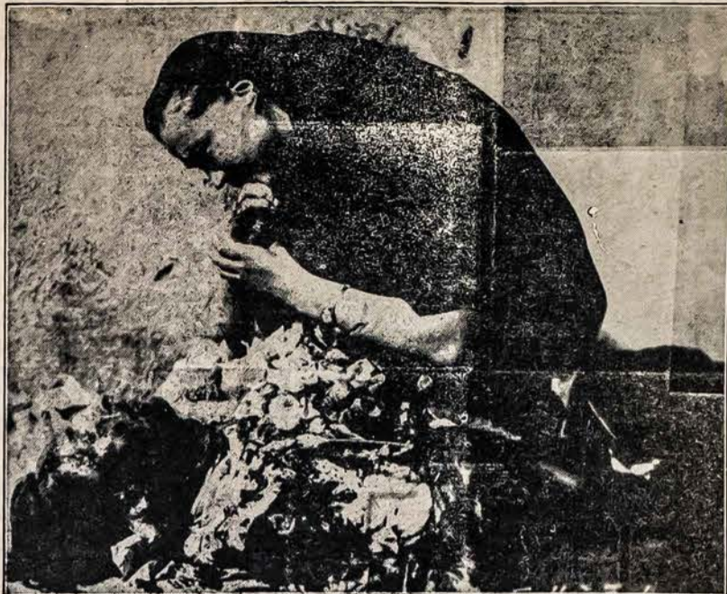
TAI SIANDIENINĖ LIETUVA!

Stalino agentai Amerikoje dalina brošiūrą "The Great Stalin Five-Year Plan." Ši brošiūra dalinama uždyka tiksliai Stalino ištikimieji pakalikam valdiškose įsteigose ir bendrakeleiviams, kad jie turėtų "svarbų" dokumentą parodyti kokius stebuklus daro Stalinas Rusijoje su savo "penkių metų" planais. Tokių planų, kaip žinote, Stalinas turėjo keleta. Ir iš visų jo tų "planų" išėjo muilo burbulas. Toje brošiūroje nurodo, kaip Stalino penkių metų planas pralėnksis Amerikos industrija. Tiksliai klausykite: kad 1950 metais Rusijoje busių net 498,000 arklių; kad busių 1,765,000 galvijų; ir 9,650,000 avių ir oškų. Bet svarbiausias triumfas bus padarytas, tai kad 1950 metuose, Stalino automobilių fabrikuose, kurių yra pribudavota Rusijoje devynios galybės, padarysį net 65,000 automobilių!