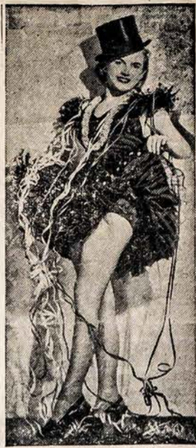
LAIMINGŲ NAUJŲ METŲ?