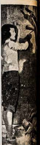
Koed-Ranky... orke mažuose... enerijas parengia... direktoriaus...

Subscription rates: In U. S. $2.50, Foreign Countries $3.50, One Year $25.00, Two Years $45.00, Single Copies 5 cents.