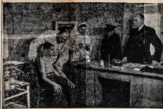
Lietuvių tremtinių stovykloje, Britų zonoje. Lietuvis gydytojas patikrina berniuko sveikatą. Stovyklos ambulatorijoje be gydytojo ir berniuko yra slaugė, UNRRA atstovas ir stovyklos reikalų vedėjas.