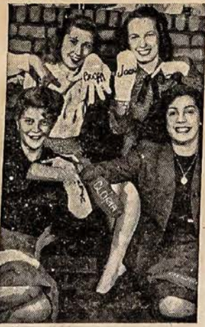
VARDAI ANT PIRŠTINIŲ

JOE'S LUNCH 362 Millbury St. - Worcester