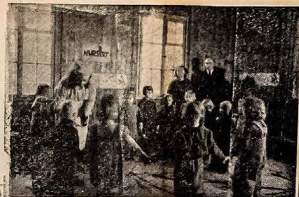
Toje pačioj stovykloje (Britų Zonoje) UNRRA atstovas ir stovyklos reikalų vedėjas lanko stovyklos mažų vaikučių darželį. Deja tokiems darželiams dabar prašo įvairių žaislų ir žaislelių.

The gifted reporter Louis Fischer, after a four month trip around Europe says that the Russian imperialistic expanse has been blocked and a time of Russian ebb is setting in. The blocking was caused: first, by American and British resistance to further expansion; second, by post-war weakness inside Soviet Russia; and third, by stubborn opposition to Russia in Germany, the Baltic States, Poland, Yugoslavia, Bulgaria and Rumania. Many writers have pointed out one hundred million people of East and Middle Europe will never tolerate domination either by the Germans or the Russians. The Germans have learned their lesson. The Russians will soon learn theirs. So there is very bright hope for Lithuania to be free, just as Poland, Yugoslavia and Rumania will be free of imperialistic Moscow.