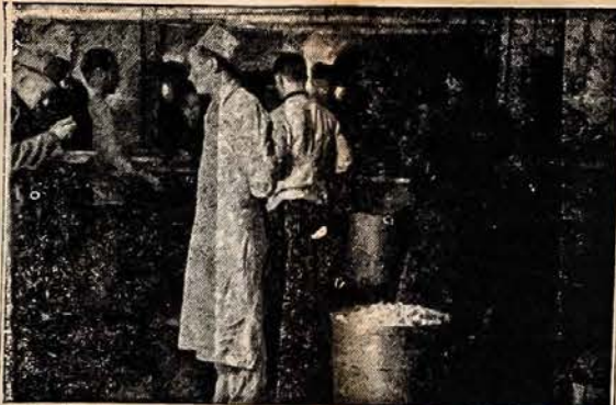
Patikrinimas virtuvėje — Britų UNRRA atstovas apžiūri lietuvių stovyklos virtuvę, kartu su stovyklos vedėju. Patikrinimo proga, britas (kairėje) ragauna tos dienos davinio sriubos. Už lango stovi eilė stovyklos gyventojų.

nemokšos pirmininko "nepasimeilins," jei neduos suprasti, kad "aš su tavim".... Tokie pirmininkai "vadovauja" organizacija taip, kaip jo kalibro žmonėms patinka ("Vadovauja, kad ir nepatinka"! ). Susirinkime dažnai "nepastėbi," kuomet šviesuolis prašo balso. Arba pradėjus kalbėti, pirmininkas duoda savo "pastabas," nutraukia kalbą, arba savo šnairavimu, pašėpimu duoda suprasti kitiems savo draugučiams, kad tas ir tas jam "braukia prieš plauką".... Jei dar neuztenka, tai pragai pasitaukias iškolios, įžeis ir pasakys, kad tokis ir tokis asmuo tik "purvo prineša ateidamas į svetainę." Aišku, turi duoti murziui kelią, nes kitaip pats išsimurzins.