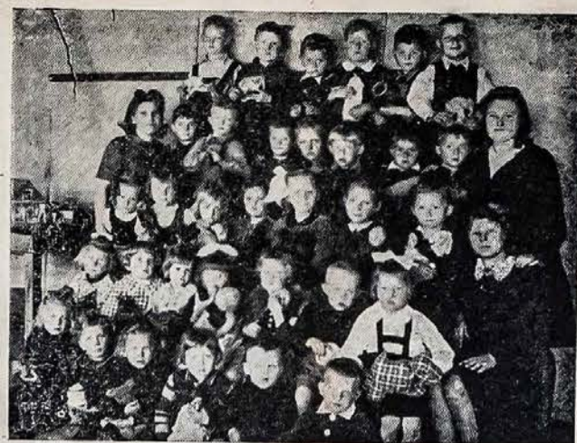
Vaikečių Darželis: — Aprengti Amerikos lietuvių padovanotais drabužiais, lietuvių tremtinių vaikečių burelis.

P. S. Del nepaprastai kilančių kainų ant spaudai