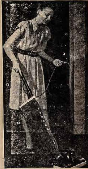
NAUJA PAGALBA Detroit. — Naujas išradimas elektra varoma vaškuoti grindis mašina. Eureka kompanija išdirba šitą mašiną, su kuria atliekama visus namų valymo darbus.