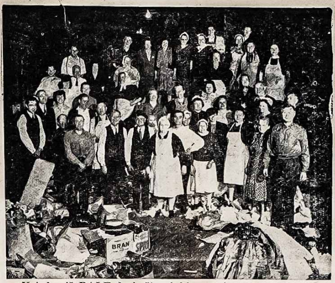
Vaidas iš BALF drabužių rinkimo vajuas. Pittsburgho lietuviai dirba talkos metu sandėlyje, rušiuodami, tašydami skirstydami ir pakuodami vajuas metu drabužius.

The Lithuanian appeal, sent to Trygve Lie, U. N. Secre-