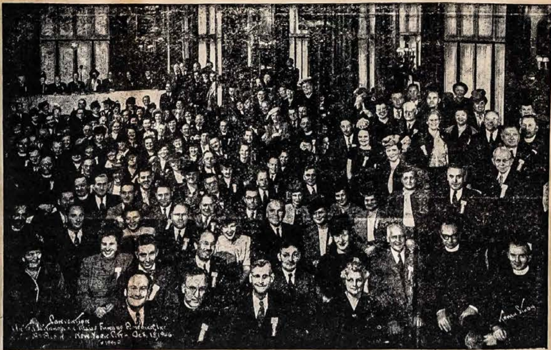
BALF Seimo, įvykusio 1946 m. spalio 18 d. Hotel McAlpin, New Yorke, dalyviai.

Tokia demokratų politiška veidmainystė privedė šalį prie suirutės. Tai buvo