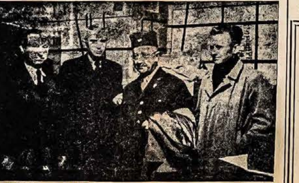
MUNCHENE — BALF sandėlyje Vokietijoje, lietuvių komisija drabužiams dalinti ruošiasi patikrinti gautą iš Amerikos siuntinį. Drabužiai, apavas ir kiti daiktai matyti pasienyje.