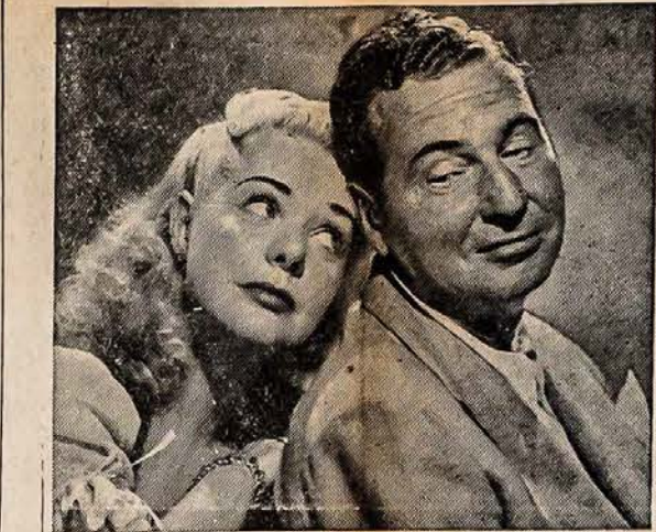
Phil Harris su savo žmona, Alice Faye Harris, sekmadienio vakarais dalyvauja NBC programoje, "Fitch Bandwagon."