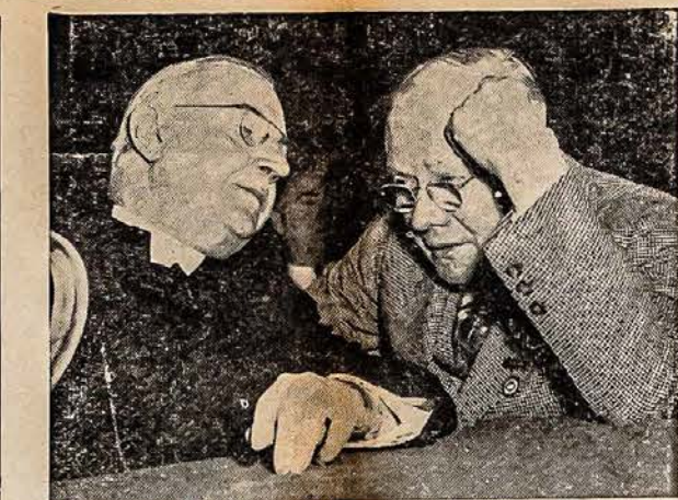
KARDINOLAS STRITCH SU DARBO FEDERACIJOS VADU Chicago, Illinois. — Kardinalas Stritch, dvasios vadas, kairėje, kalbasi rintai su darbo vadu, William Green, 65-tame metiniame A. F. of L. seime. Green, savo atidarymo kalboje, pasmerkė diktatorystę, komunizmą, reakcionierius ir visas ideologijas kurios netinka mūsų vyriausybės formai.