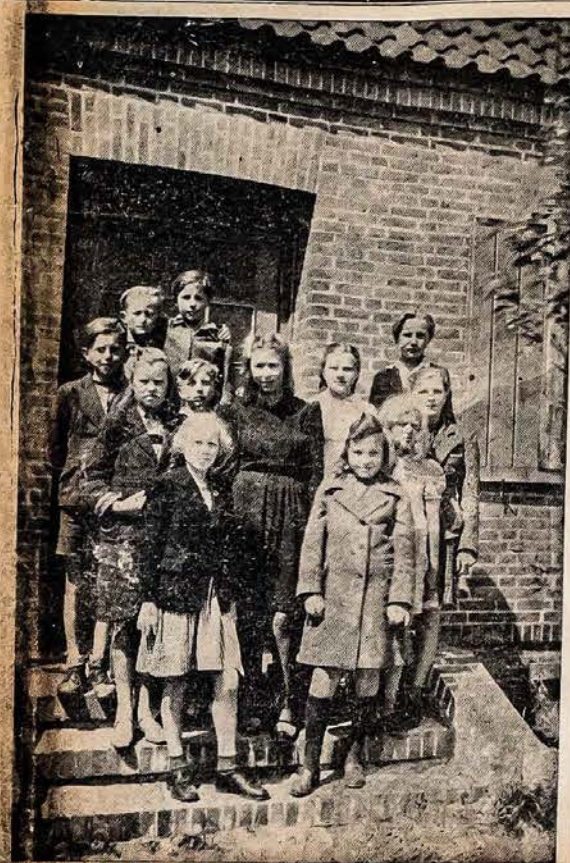
VIENA SAULETĄ DIENĄ... Penktąjį lietuvių pradžios mokyklos klase, prie mokyklos durų, Nymindegabo lietuvių stovykloje, Danijoje.