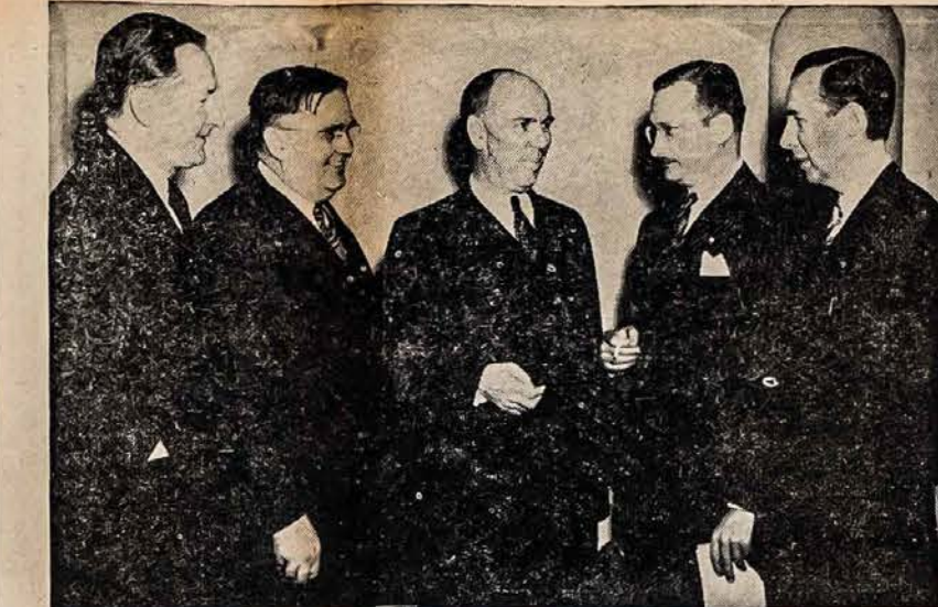
LIETUVIAI REPUBLIKONAI SUTINKA SENATORIŲ BREWSTER, CHIKAGOJE

Po šio nuotikio, Rooseveltas davė Stalinui ką jisai tikrai norėjo, nežiurint, kad Churchillas buvo priešingas aklam Roosevelto atsidavimui Stalinui malonei. Rodosi Churchillio širdžiai reikėjo suminkštėti ir būti