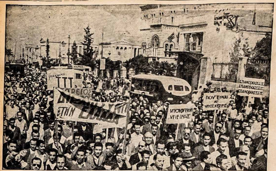
DEMONSTRACIJA ATĖNUOSE. Atėnai, Grekija. — Grekijos civiliai darbininkai demonstruoja prieš Suvienytų Valstijų ir Britų pasiuntinybes. Minia buvo sužadinta dėl atlijantų nerėmimo Grekijos reikalavimų UNO konferencijoj.

In conclusion, we, Americans of Lithuanian and Baltic Descent, comprising over one and one quarter million people, desire and plead for permanent peace but not at a price of freedom, liberty and pursuit of happiness. We plead for peace based on moral justice, fairness and law with favors to none and equality to every portion of humanity, great or small. We beseech, therefore, to take immediate action in Baltic question and to apply the principles for which so many died, as expressed in the Atlantic Charter and The Four Freedoms.