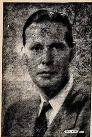
MAURICE J. TOBIN

Gubernatorius Maurice J. Tobin, šią savaitę įrodė kokį progresą Massachusetts valstija yra atsiekusi po jo vadovybę per paskutiniū du metu ir prašė jį per-rinkti ateinantį antradienį, idant galėtų užbaigti darbą, kurį pradėjo. Gubernatorius Tobin prieš-rinkimus varė smarkią agitaciją ir kalbėdamas didelėms minims, jisai paminėjo keleta atsiektų žygių savo administracijoje: Gubernatorius Tobin veikė greitai ir sąmoningai perėitą pavasarį, kada OPA staiga nuėmė nuomų kontrolę. Jisai pirmas gubernatorius kurs turėjo paruoštą planą ir jį įvykdė, tuomi išvengė netvarką Massachusetts valstijoje. Po gubernatoriaus Tobin vadovybste, Logan Tarptautinis Aerodromas tapo vienas iš puikiausių visoj šaly ir Massachusetts valstijoje oro stotys visur padidintos ir pagerintos. Susiekimo ir siuntinių persiuntimo oru plaukimas įrodė, kad valstija gali prašyti savo dalį pasaulio pramonės. Jisai parupino išleisti įstatymus kurie padidino pašalpas seniems žmonėms ir našlaičiams, del ko sulaukė kritikos iš republikonų pusės. Jisai taipgi suteikė pensijos sistemą miesto apskrities ir valstijos darbininkam,