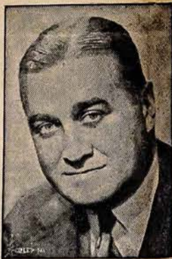
PAUL A. DEVER

Buvęs Teisininkas Prokuroras Paul A. Dever, kandidatas į Leitenantus Gubernatorius per visą savo visuomenišką tarnystę kovojo už darbo teises ir darbininkų gerovę. Jo 12 metų rekordas Valstijos Tarnystėje vedant kovą už patobulinimą Darbo Santykių Akto, įsteigimą Seno Amžiaus Pensijos Sistemos ir globojimas darbininkų sveikatą ir saugumą užpelnijo jam pilną organizuoto darbo paremimą.