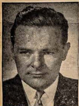
Buvęs senatorius Henry Cabot Lodge, Jr. rezignavo iš Senato

1944 metais, stojo į Armiją ir dalyvavo Europos kare. Tai buvo pirmutinis senatorius po Civilio Karo palikti senatą del tarnystės Armijoje. Lodge jau nuo savo jaunystės dienų dalyvavo politikoj, 1936 metais išrinktas į Suv. Valstijų Senatą, vėl perinktas 1942 metais iki 1949 metais, ir būtų buvęs dabar Senate, jei nebutų rezignavęs stoti į karą. Budamas Senate, Lodge atliko daug naudingų darbų. Sie rinkimai svarbūs, nes Senatoriai bus renkami iki sausio 1953, gi iki to laiko bus daug taikos, militariškos apsaugos, darbo ir pramonės klausimų nuspręst. Lodge kaip tik yra pasiruošęs šio moderniško amžiaus problemoms aprūpinti.