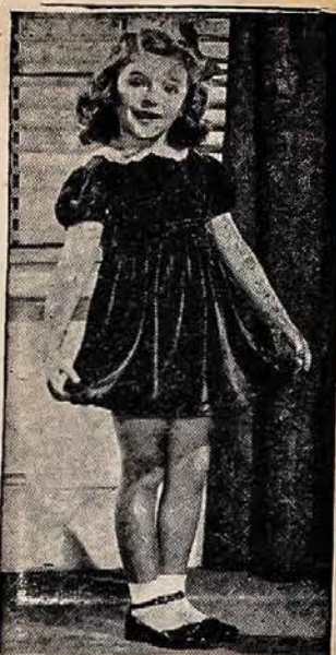
IŠ SENOS SUKNELES PASIUVO NAUJA

Medžiai — milžinai, kaip lietsargiai plėvesuojantieji vabzdžiai — ar tai nepanašu į pasa-