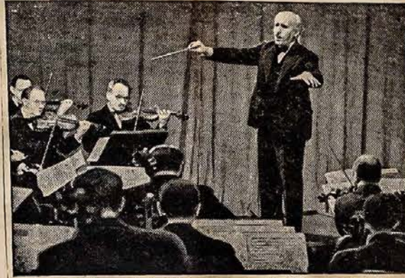
Arturo Toscanini atidarys reguliarišką rudeninį - žieminį sezoną NBC Symphony orkestro sekmadienį, spalio 27-tą. Tai jo dešimti metai kaip žymios muzikališkos organizacijos direktorius. Atidarymo programa bus ištiesi iš Berlioz kurinių perstatymo, su smuikininku William Primrose kaip solistas.