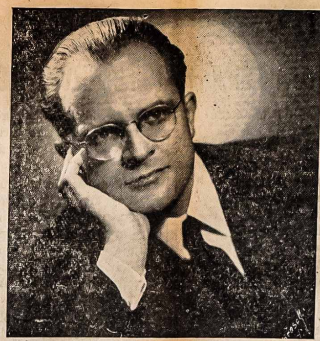
Vytautas Bacevicius, pianistas-kompozitorius