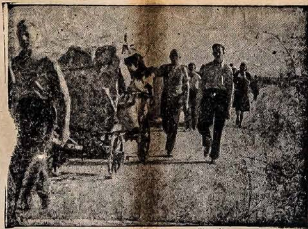
ZYGYJE I VAKARUS — Įsikinkę į vežimėlius, pakrautus pačiais gyvenime reikalingiausiais daiktai, tremtiniai anuo metu bėgo ieškodami prieglaudos ir užtarimo.