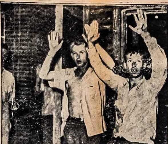
PO GINKLUOTA SARGYBA ATHENS, TENNESSEE. — Šerifai buvo išvesti iš kalėjimo po pasidavimo veteranam Tennessee paskyrimų kovoje.

L. Menken, a Baltimorean noted for his sharp tongue and scholarly knowledge of the American language, declared the other day that one of the results of this war was that "the Lithuanians, and so are enslaved." The First