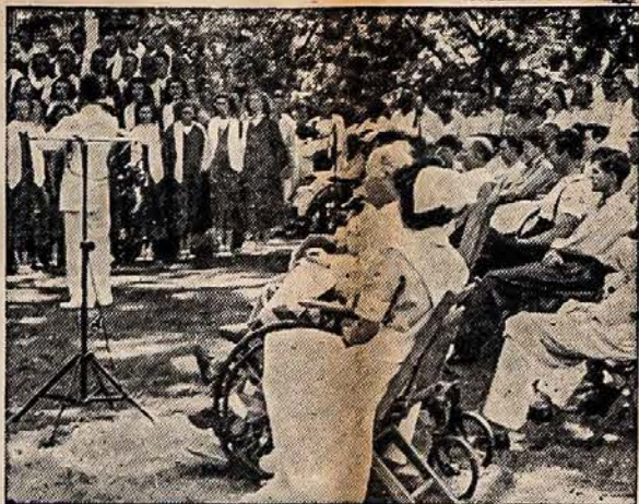
MUZIKA SUZEISTIEM VETERANAM

Printed at Second Class Matter September 29, 1914, at the Post Office at Worcester, Mass., under the Act of March 3, 1879.