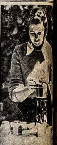
GREITAM VALGIŲ GAVIMUI

Senas Laidotuvių Namas 13 Ellsworth St., Worcester 3, Mass. Tel. 4-3501 - 4-3865