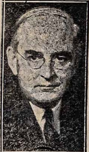
SENATORIUS ARTHUR H. VANDENBERG

Sovietų Rusijos užsiuominimas eneksuoti Lietuvą, Latviją ir Estiją yra, jo įsitikinimu, nieku nepateisinama nedorybė ir sutreptimas visų principų, pažymėtų Jungtinių Tautų Charteryje. Čia senatorius paėmė pasaulio organizacijos charterio tekstą, atspausdintą mažoje knygelėje, ir nurodė tą vietą kur kalbama apie tautinio apsisprendimo teisę. Aišku, tarė jį, kad tie rinkimai, kurie buvo pravesti Baltijos kraštuose, yra tik pasityčiojimas iš tautinio apsisprendimo.