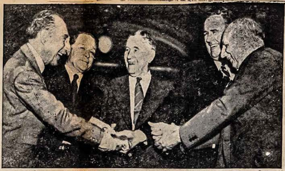
DEMOKRATAI SENATORIAI ATSIŠVEIKINO WASHINGTON, D. C. — Senatoriai atsisveikino prieš išėinant namon atostogoms. Tai ilgiausios jiems atostogos po dešimtis metų. Iš kairės į dešinę: sen. Theo F. Green, iš Rhode Island, senatorius James W. Huffman, iš Ohio; senatorius Alben W. Barkley, iš Kentucky; senatorius Olin D. Johnston, C. C. ir senatorius George L. Radcliffe, Maryland.

Šita organizacija, kurios steigime pats senatorius Vandenberg dalyvavo kaip J.A.V. delegacijos narys San Francisco konferencijoje, turi uždavinį ne tik palaikyti tarptautinę taiką, bet ir pašalinti blogumus iš pirmesnių laikų, nežiurint kokios jie būtų kilmės. Šitas labai svarbus paragrafas UN Charteryje, straipsnyje 14-tam, buvo priimtas San Franciscoje daugiausia sen. Vandenbergo pastangų dėka. Čia, jo manyma, gali būti raktas ir į Lietuvos ateities klausimą. Kada ateis momentas šitą klausimą iškelti, kol kas sunku pasakyti. Pasaulyje santykiai dabar keičiasi. Galime susidurti su visai netikėta situacija už kelių savaitių; gali praieiti mėnesiai ir metai. Turime