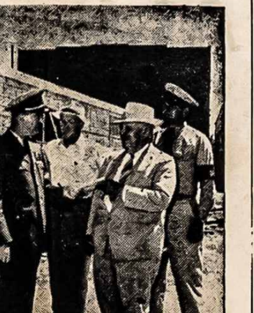
LAIVYNAS KARIAUS TYRUOSE Phoenix, Arizona — Suv. Valstijų Laivynas parupino milžinišką garinį — elektriką gaminantį traukinį kariauti prieš sausrą tyruose. Su šio traukinio elektrą, Arizona ukininkai galės pompuoti vandenį savo derliams. Šis traukinys kainuoja $2,500,000 ir įrengtas daug smulkiau neg submarinas.

Per Mariją — į Marijos šalį Lietuvą! Lietuvišką širdį — jaučiate, kam ko reikia ir duodate neprašytas. (Lietuviui tikrai verčiau kelis kart duoti, negu vieną kart paprašyti!). Aš tiesiog stebiuosiu pasiųstų šios šalies gyventojų giminėms ir draugams Europon. Daugiausia nusikandimų liečia siuntinius pasiųstus Lenkijon, Prancuzijon ir Italijon. Kaikurios vagystės galėtų atsitikti laike muito peržiūrėjimų, bet didžiama apiplėšimų įvyksta kada siuntiniai negerai surišti, atsilaidžia pakeliai, tai pašto darbininkai gali pasakyti, kad žuvę daiktai išpuolė. Aprauda ir registracija dar nesutvarkyta su tomis šalimis. Todel Pašto Departamentas tegali tik patarti amerikonom siuntėjams, kad sudėtų ir surišytų tvirtai tą, ką siunčia, ir ant apsaugoti siuntinį nuo prapuolimo.