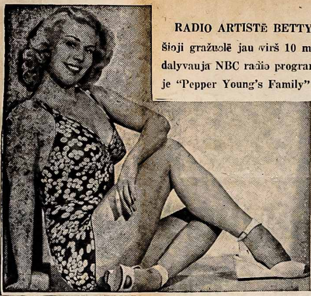
RADIO ARTISTĖ BETTY Šioji gražuolė jau virš 10 metų dalyvauja NBC rašio programoje "Pepper Young's Family"