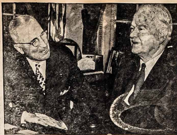
TRUMAN PAGYRĖ HOOVERĮ WASHINGTON, D.C. — Buvęs prezidentas Herbert Hoover, dešinėje, išdavė raportą iš savo raportu apie pasaulio sušelpimą maistu. Prezidentas labai išgyrė jį už atliktą darbą.