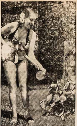
APSISAUGOJA NUO NUODINGŲ ŽOLIŲ

Ne tik prieš menševikus Koba buvo visos priemonės pateisinamos. Jis "visas priemones" panaudodavo ir kituose atsitikimuose. Jis turėjo didelį gabumą "kitus raginti veikti, o pats pasilikti nuošaliai" arba, kaip rusai sako, jis mokėjo svertimomis rankomis traukti iš ugnies kaštanus. Tą patvirtina tokie faktai: