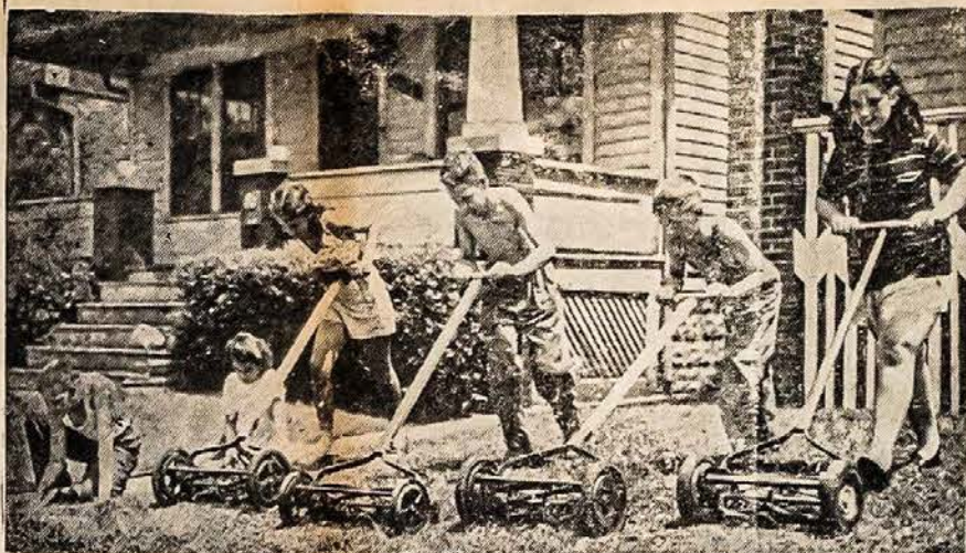
DIRBA IŠGELBĖTI DRAUGES REGEJIMĄ