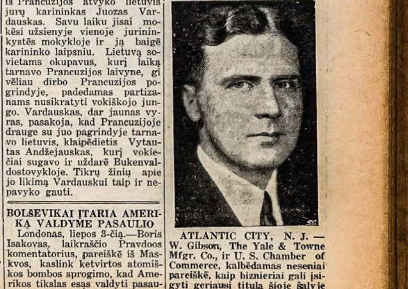
ATLANTIC CITY, N. J. — W. Gibson, The Yale & Towne Mfr. Co., ir U. S. Chamber of Commerce, kalbėdamas neseniai pareiškė, kaip biznieriui gali įsigyti geriausį titulą šioje šalyje "Gero Piličio."