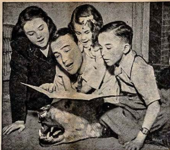
TEVAS SU SAVO MUZIKALISKA ŠEIMA

Visi šie nauji rezervai — pastiprinimai buvo gatavi stot kautynėms ant pareikalavimo. Tad mes nuo pirmųjų fronto li-