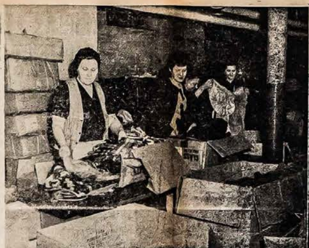
PITTSBURGHO lietuvės rupestingai skirsto ir pakuoja lietuviams tremtiniams suaukotus drabužius, kurie išsiunčiami į BALF sandėlyje. Drabužiai sandėlyje dar kartą perskirtojami ir siunčiami Europon, kur išdalinami lietuvių stovykloms.

4. Visi, kurie prieš savo valią buvo evakuoti iš namų savo šalyje (ne Vokietijoje) vokiškos militarės vyriausybės del militarinių priežasčių apart militarės tarnybos.