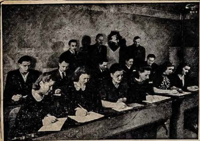
Tipiška suaugusių mokykla lietuvių stovykloje. Visose lietuvių tremtinių stovyklose yra įsteigtos mažieji ir suaugusiems mokyklos, kuriose jaunimas tęsia nutrauktą mokslą, o suaugusieji mokosi svetimų kalbų ir specialybių.