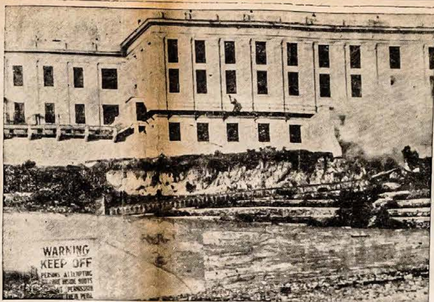
KALINIAI SUKILO SAN FRANCISCO, CALIF. — Alcatraz kalėjimo sargas glaudžiasi prie sienos žemiau lango išvengti ugnies liniją nuo ginkluotų kalinių Federaliame Kalėjime, gi dešinėje sprogo ašaru dujų sviedinys.

šalys sudarė koalicines valdžias kad greičiau ir stipriau sutvarkyti savo krašto reikalus, tai mes kas sau, paskyromis norime tai atsiekti. Vargas tai šaliai ar valstybei, kurios žmonės negali savo tarpe susiprasti ir susitaikinti.