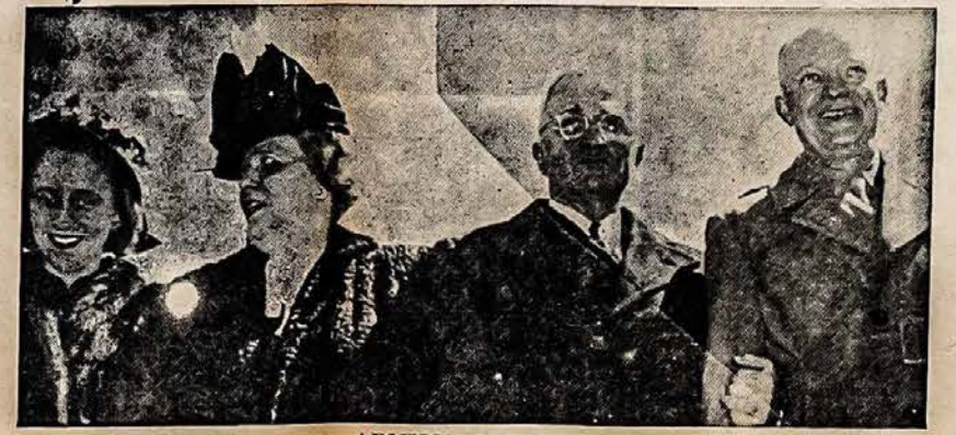
ARMIJOS DIENOJE Chicago, Ill. — Prezidentas Truman laikydamas Generalą Eisenhower už rankos su savo žmona, ir duktere Margaret, matė penkių mylių, dviejų valandų parodą. Po parodos prezidentas nuvyko į Kareivių Lauką, kur susirinko 80,000 žmonių klausyti jo kalbos.

New York. — Balandžio 24 d. Londone datuota žinia, The New York Times praneša, kad išvietintų Lietuvos žurnalistų komitetas atsisaukė į pasaulio sąžinę reikalaujant atskleisti tiesą apie padėtį Lietuvoje. Joks laisvojo pasaulio spaudos atstovas nebuvo įsileistas į Lietuvą... Pasaulis begėdiškai tebemai-