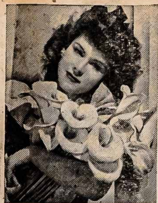
VELYKŲ GRAŽUOLĖS — Eileen Barton su glėbiu velykų lelijų. Gražuolė Barton dalyvauja NBC radio programoje vadiname "Eileen Barton Show."

In your Army Day speech you emphasized that this country is helping and is going to