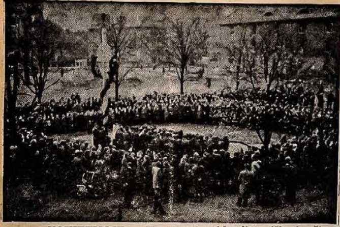
VOKIETIJOJE — Hannau stovyklos lietuviško kryžiaus įsventinimo iškilmės.