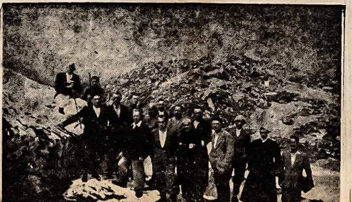
ITALIJOJE — Lietuviai tremtiniai ant amžinojo ledyno Alpių kalnuose, Italijoje.

TEHRAN (Irane) — Kurdu tautelė, kurią sovietai nori padaryti dalimi rusų imperijos A-