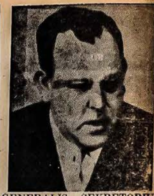
GENERALIS SEKRETORIUS — Trygve Lie, buvęs Norvegijos Užsienių Reikalų Ministeris parodomasis laike kalbos į U. N. O. Londone. Po užėmimo sekretoriaus vietos U. N. O. jis buvo rusų perstatytas prezidentu visos U. N. O., bet buvo nugalėtas (viršytas) Paul Henry Spaak atidaryme Generalio U. N. O. susirinkimo.

Pažvelgiu laikrodin: 11,05 val. Tolumoje jau girdėti priešlektuvinių pabuklių kanonada. Taip pat ausis jau pagauna besiantinamųjų bombonešių krikimą. Kiekvieną sekundą šis krikimas, vis grėsmingesnis. Buvęs rusyje klejėjimas ir juokas nutrūksta. Besiantinantis motorų užimas, rodos, tiesiog lenda į visus slėptuvės kampus. Jų garsas hipnotizuoja visus čia susirinkusius, kaip koks kerėtojas, kad užburia gyvatę ar minia. Neišvengiama mirties grėsmė suartina visus gyvius. Bombonešių bangos užimas, štai, jau virš mūsų galvų. Aplink mus jau aiškiai girdimi duslūs ir tolimesni bombų sproginiai. Staiga, visi išgirstame širdį veriantį kaukimą. Tai artinasi bombos, kurios tik paleistos iš virš mūsų esančių bombonešių junginio. Kaukimas ir stugimas artėja į mus neapsakomu greičiu. Visi esantieji rusyje su artėjančiu pragarišku triukšmu, linksta artyn prie rusio grindų. Jaučiu, kaip ir visi čia esantieji, kad šios bombos mums skirtos. Viena sekundė, dvi, trys - rusyje viešpatauja mirtina tyla. Visi sulinkę prie grindų laukia... Staiga, neaprasomas griaustinis ir žemės drebėjimas sujudina visą žemę, namą, rusį ir net pasamone, Atsipalaiduoja įsitempę nervai.