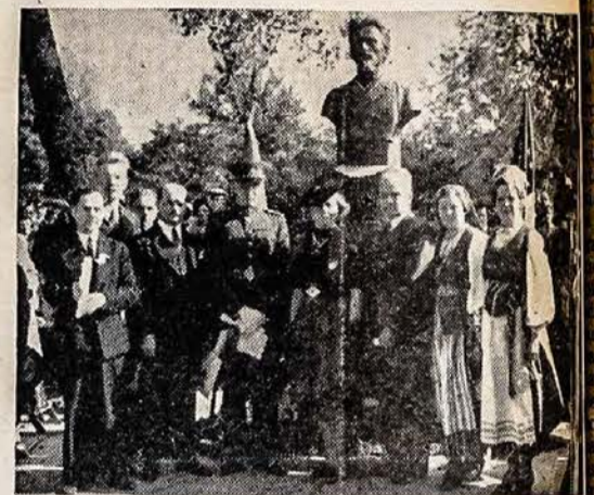
Dr. B. Kudirkos paminklo atidengimas Clevelando Lietuvių Kultūriname Darželyje. (Paminklas padovanotas iš Lietuvos, 1938 metais).