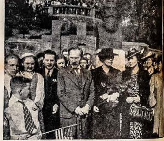
Lietuvos Prezidentas Antanas Smetona lanko Clevelando Lietuvių Darželį, kaip tik atvažiuo į Ameriką. Matosi būriu Lietuvių prie Dr. J. Basanavičiaus paminklo.