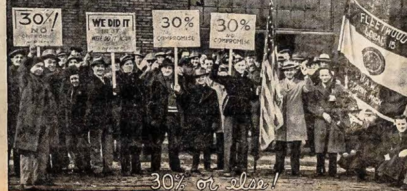
30% or else!