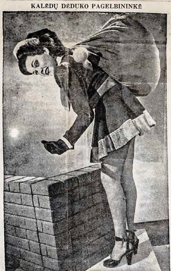
KALĖDŲ DĖDUKO PAGELBININKĖ