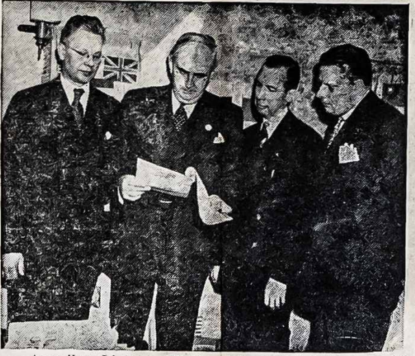
Amerikos Lietuvių Misijos delegatai įteikė A. L. M. memorandumą, San Francisco Konferencijoj, Amerikos delegacijos nariui, Senatoriui Thos. Connelly — 5/9/45.