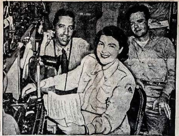
PIRMOJI MOTERIS PRANEST ŽINIAS PER RADIO IŠ ŠANGAJAUS