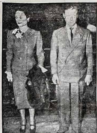
WINDSOR KUNIGAİKSTIS IR KUNIGAİKSTIENE

Tai gerbiamas dėde, parašykite man laišką kada gausite mano, nes labai norisi žinoti kaip