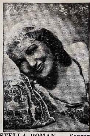
STELLA ROMAN — Soprano

Antradienio vakaro programa buvo paskirta pergalei ir taikai, laike kurios bus išpildytas nau-