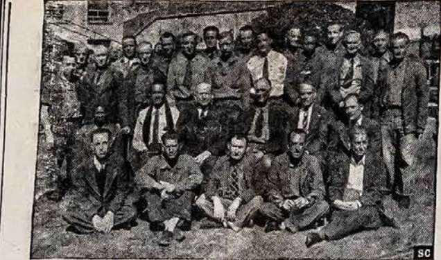
NELAISVIAI STUDIJUOJA SVENTRASTI PER RADIO Šie San Quentin kalėjimo įniamiai Kalifornijoje yra biblijos mokyklos nariai. Mokykla vedama nemokamai sekmadienio rytais per Mutual Broadcasting sistemą. Šioji mokykla turi virš 200-000 klausytojų arba narių Lekcijos yra dėstomas angliškai, ispaniškai, portugališkai, vokiškai ir Braille (sistema del neregijų.)