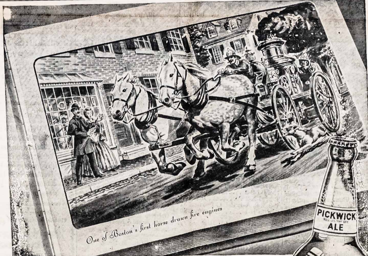
One of Boston's first horse drawn fire engines