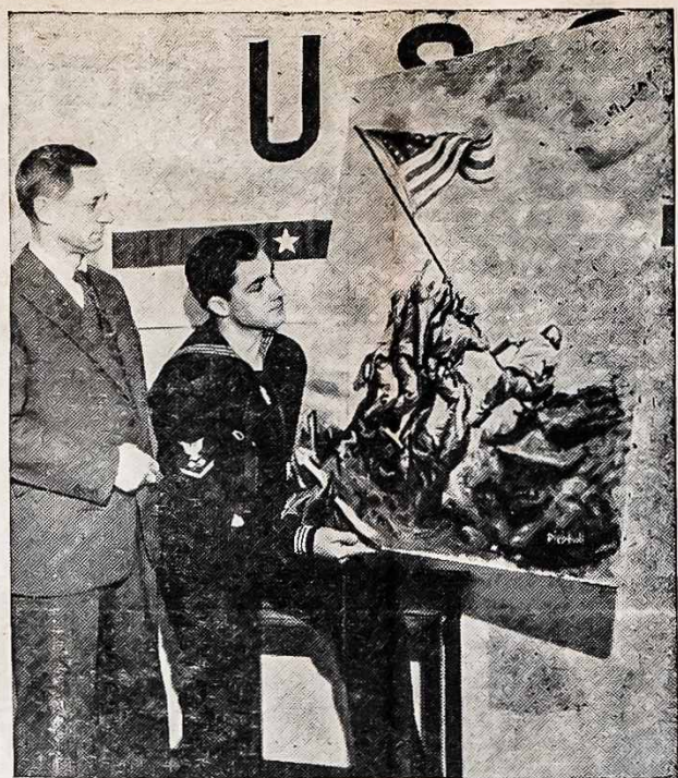
ISTORIŠKO MUŠIO VAIZDAS DEL U. S. O.