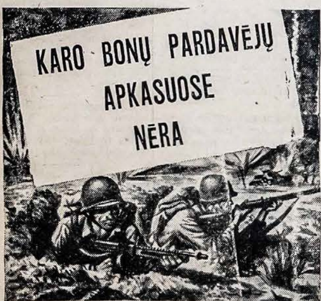
Nereikia pardavėjo raginti šiuos vyrus pirkti Karo Bonus.

Jei savininkai pasikeitė laikotarpį tarp registracijos pareiškimo išpildymo dienos ir 1945 metų gegužės 5 dienos, minėtąjį blanką reikia išpildyti prieš 1945 metų gegužės 31 dieną. Jei pasikeitimas įvyko po gegužės 5 dienos — tada pranešti reikia laike 10 dienų po pasikeitimo dienos.