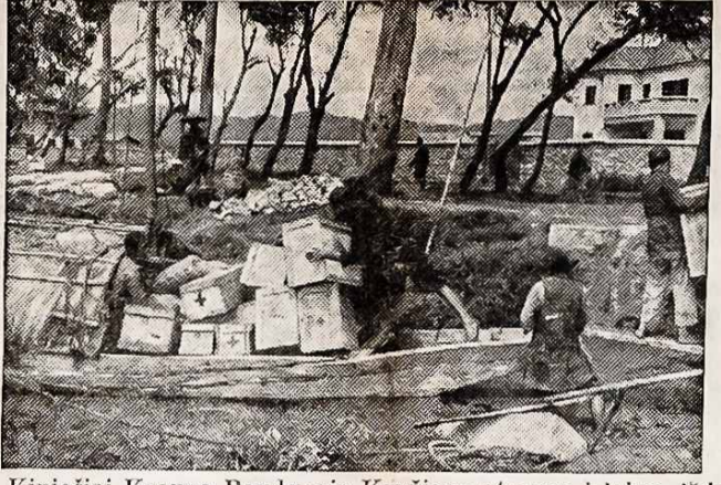
Kiniečiai Krauna Raudonojo Kryžiaus atsargą i laivą, išsilanimui sužeistiem kareiviam i civiliam. Šios atsargos sykiu su vaistais, medicininis ir chirurgiškais instrumentais reguliariškai lėktuvais atvežamos per Himalaya kalnus iš Indijos del Kinijos Raudonojo Kryžiaus nuo Amerikos Raudonojo Kryžiaus.

Iš aukščiau pateiktų faktų išplaukia, kad, pasakę "šalin ginčus", mes neprieisime tiesos, o