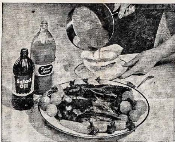
ŠUTINYS IŠ MĖSOS IR TOMEIČIŲ

tė bukliai, net pasikiviedami kiniečius pasitariman, kurių nuotauka link Rusijos yra labai gerai žinoma. Tačiau iš to matosi, kad mūsų Prezidentas nebus jau taip minkštas derybose, lengvai nusileidžiant ir greitai paroduodas tarptautiniuose klausimuose. Faktina tiesa šiame dalyke yra, kad ši konferencija nėra karo planavimas, nei militaris rizikavimas, kuriame talkininkai turi paaukoti viską išsigelbėjimui nuo mirties. Amerikos propaganda yra silpna. Iš kitos pusės ši konferencija nėra ir taikos planavimas. Taiką gali spręsti tik didžiosios tautos, kurios aktyviai kariauja. Ši konferencija yra tikta, kaip derybos, kuriomis politikai, valstybininkai, propagandistai susirinko išdirbti naują planą, pokarinės busimos tautų organizacijos veikimui. Jei Amerikai reikalinga propaganda dėl šios konferencijos, tai mes ją turim kuogeriausiai išrašyta akmeninėje plokštėje prie įėjimo į dailės muziejų Aukštinių Vartų Parke, netoli tos vietos kur vyksta konferencija. Tenai parašyta: "Valstybės garbė remiasi ant kiekvieno individo, "Tautos garbė remiasi ant valstybės, "Pasaulio laimė remiasi ant tautų savigarbos".