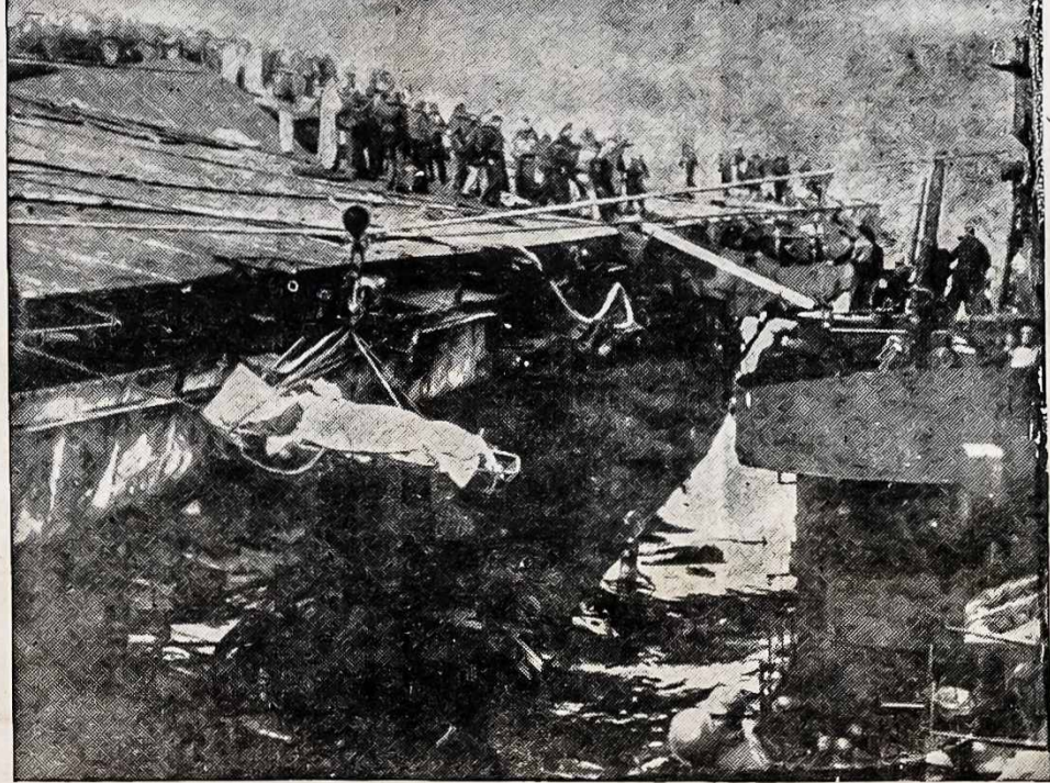
JUROSE IŠSIGELBĖJO DAUG GYVYBIŲ ANT UŽPULTO LĒKTUVNEŠIO