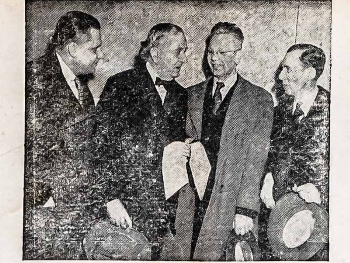
Amerikos Lietuvių Misijos delegatai įteikė A.L.M. Memorandumą, San Francisco Konferencijoje, Amerikos delegacijos nariui, Senatoriui Thos. Connolly, 5/9/45.