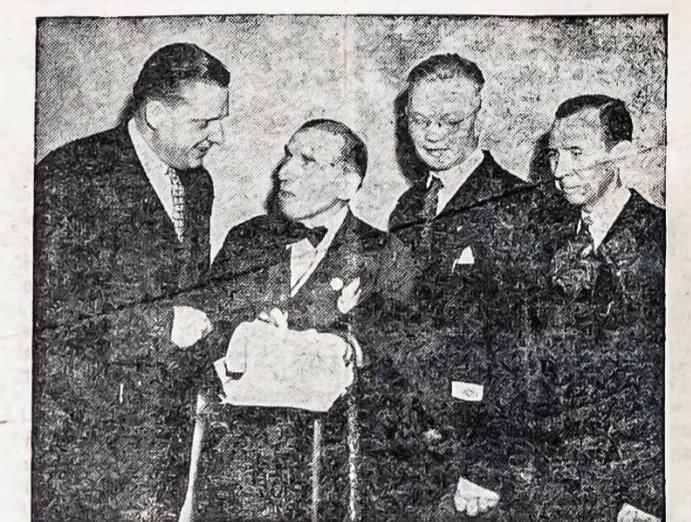
Amerikos Lietuvių Misijos delegatai įteikė kopiją A. L. M. Memorandumo, San Francisco Konferencijoje, Amerikos delegacijos nariui, Kongresmeniui Sol Bloom, 5/9/45.