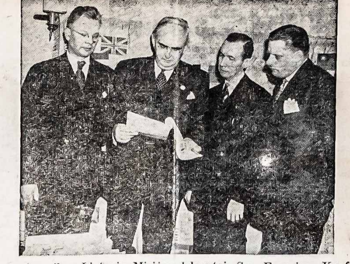
Amerikos Lietuvių Misijos delegatai, San Francisco Konferencijoje, įteikė A. L. M. Memorandumą, Amerikos delegacijos nariui, Senatoriui Arthur Vandenburg, 5/9/45.