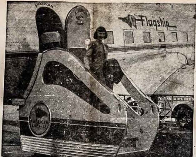
GRAŽUOLĖ SU GABUMAIS

Varėna jauniausias Lietuvos, arba Dainavos miestelis, bet pasi-vojio ir pralenkė kitus Dainavos miestelius augimu ir turtejimu. Varėna buvo prieš pirmąjį pasaulinį karą vienas iš turtingų ir sparciai augusių Dainavos miestelių. Varėna taipgi randa-