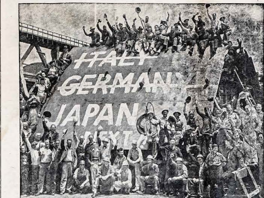
SEKANTI STOTIS—JAPONIJA Los Angeles, Calif. — Darbininkai sustojo pa reikšti savo džiaugsmą del gerų karo žinių pradėdami statyti 450-tą laivą, Los Angeles, del California Shipbuilding korporacijos. Jau Italija ir Vokietija nugalėtos, tai liekasi Japonija.