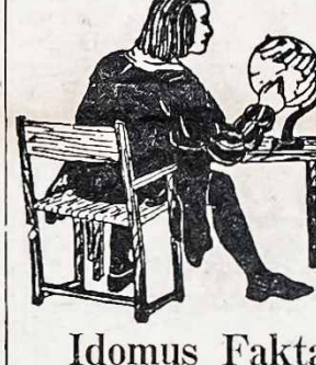
Idomus Faktai Apie Prūsų Lietuvą

Siandien, gegužės 7-tą, Molotovas turėjo spaudoje konferenciją St. Francis viešbutyje. Atėjo neišvengiamas paklausimas: "Kas atsitiko su 16 dingučių lenkų? Sovietų užsienio reikalų komisaras perskaitė iš anksto paruoštą pareiškimą, su žodžiais: "...Mes išsprendėme Jugoslavijos klausimą... ir mes išsprendėme lenkų klausimą".