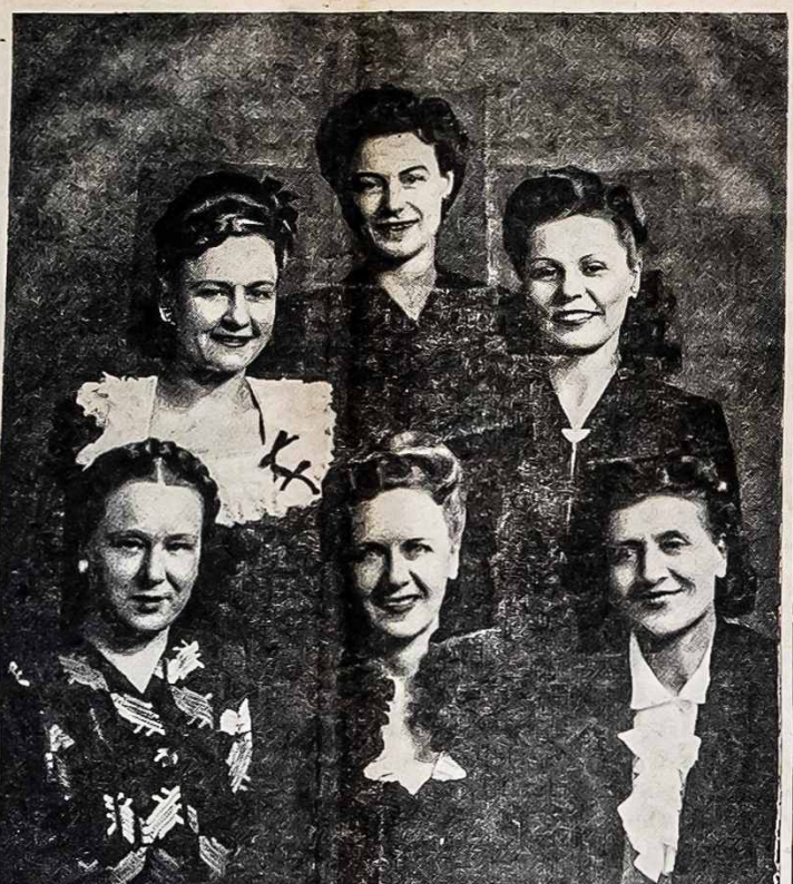
NEW YORKO ARTISTĖS MASSACHUSETTS VALSTIJOJ

Greta anglų imperijos stovi rusų imperija, kuri pergyveno daug vidaus ir išlaukinių sukrėtimų—karų, tragedijų, bet išliko nesugriauta. Rusų vadai kaip ir anglų, pasirodė genialūs vairavime savo valstybės vairo. Rusai valdydami aziatiską tautas ilgus amžius išmoko pakantros ir tvirtos valios ir vienybės laikytis. Nors rusų liaudį kamavo valdovai, carai, dabar kamuoja ją naujos rusės autokratijos ir žandarai, bet rusai kan-