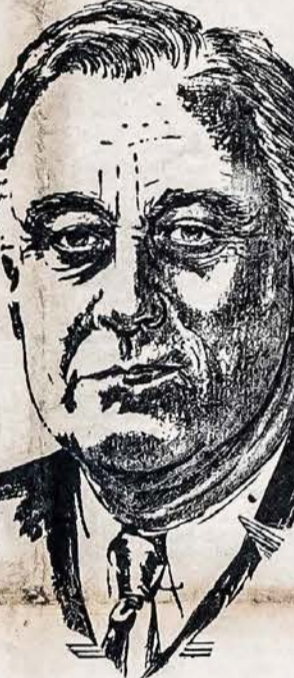
Mirė Prezidentas Franklin D. Rooseveltas

Visas parengimas, tvarka, ir abelna dvasia buvo labai teigiamos ir tiesiog užavėjančios. Publika buvo nepaprastai rimta ir inteligentiška ir jokios betvarkės nebuvo. Šis bankietas turės savas pasekmes. Per jį Lietuva įgijo daug žymių ir galingų draugų. Per jį tapo išaiškinta Lietuvos byla rimtai ir plačiai. Per šio bankieto surengimą Lietuvos bylai daug dapedės. Po bankietui dar ilgai kalbėjosi valdžios pareigūnai su musų kitais svečiais, su kuriais sedėdami visą vakarą gavo progą gerai susipažinti.