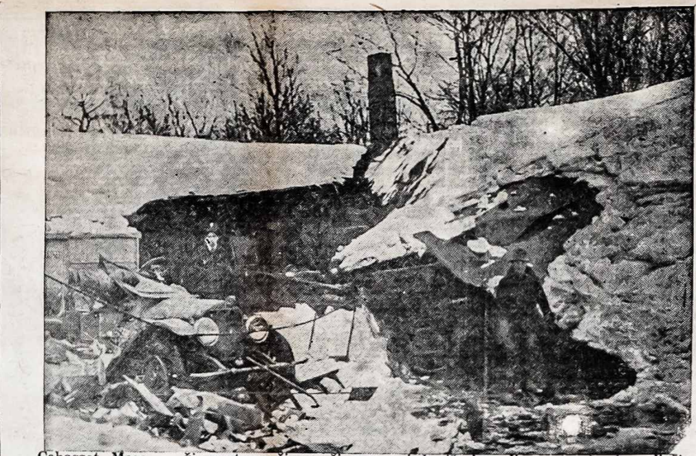
Cohasset, Mass. — Čia matome žiurų žiemos vaizdą iš daugelių metų, kuris paliečia visą šalį. Čia vaizduoja garadžių su įpuolusiu vidun stogum, kuris neatlaikė sniego spaudimo. Massachusetts Valstijoje dar ir dabar kašasi iš po sniego, kuris gyventojams daug žalos padarė — daug miestų nutraukė susisiekimą, pajėgą ir tuomi uždarė šviesas, palikdamas gyventojus tamsumoje.

Remdamasi Rusijos Federacinės Socialistinės Tarybų Respublikos paskelbta visų tautų teise laisvai apsispręsti ligi visiška atsiskiriant nuo valstybės, kurios sudėtyje jos yra, Rusija be atodairų pripažįsta Lietuvos Valstybės savarakiškumą ir nepriklausomybę su visomis iš tokio pripažinimo einančiomis juridinėms sėkmėms ir gera valia visiems amžiams atsisako nuo visų Rusijos suvereniteto teisių, kurių ji yra turėjusi Lietuvos tautos ir jos teritorijos atžvilgiu.