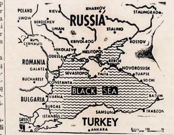
Žemėlapis, kuris parodo Juodąsias Juras ir šalis kurios su jura susisiečia. Čia neseniai prie Juodųjų Jūrų—Jaltoje, Kryme, įvyko "Trijų Didelių" konferencija, kurioje dalyvavo Maršalas Stalinas, Prezidentas Rooseveltas ir Premieras Čurčilas. Konferencijai vieta buvo parinkta taip slaptai, kad nė pati didžioji pasaulio spauda nežinojo; Londono spauda skelbė konferencijai vieta Sochi, Berlynas—Romunijos porte—Constanta, ir kiti dar kitur, o konferencija įvyko ant Jaltos byčių, kur Kremlino komisari maudosi.

žmogus — kitaip sakant — išradimų raganius, taip pranašauja apie trečiojo karo neišvengtą pasikartojimą ir apie sunaikinimą sostinių į valandos o ne metų laiką. Be abejonės, kad kilus III-čiam Pasauliniui Karui, ir jeigu mūsų šalis įeity į busintį karą, tai nė vienas Suv. Valstijų miestas nebus užtikrintas saugumu nuo iš Europos atskrendančių raketinių bombų, kurios galės bile miestą į pelenus paversti į trumpą kelių valandų laikotarpį.