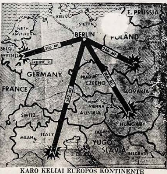
KARO KELIAI EUROPOS KONTINENTE Žemlapis viršuj rodo tolumus nuo kovos laukų pradedant Berlyno priemiesčius.

Washingtonas — Kietojo Karo Administratorius, Harold L. Ickes, praneša, kad Naujųjų Metų pradžioje bituminijaus anglių buvo sunaudojama daugiau, negu pagaminama. Skaičiai rodo, kad per gruodžio mėnesį anglių sunaudota buvo 11,500,000 tonų daugiau, nei pagaminta, ko dar nėra buvę nuo pat šio karo pradžios.