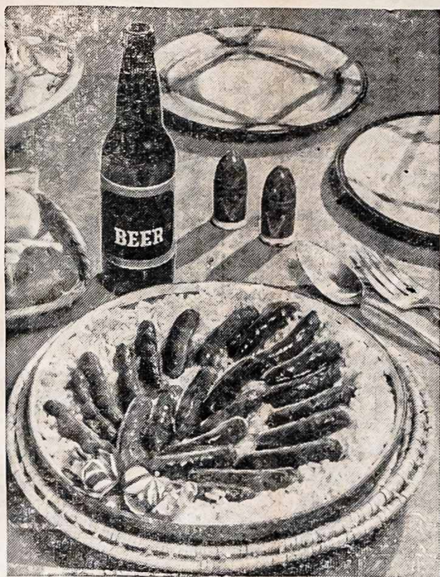
KIAULIENOS DEŠRAITĖS ALAUS PADAŽE

Kiaulienos Dešraitės, tarp tų mėšų, kurios dabar šiandien yra krautuvėse, padaro gerus pietus, kada paruošiami alaus padaže.