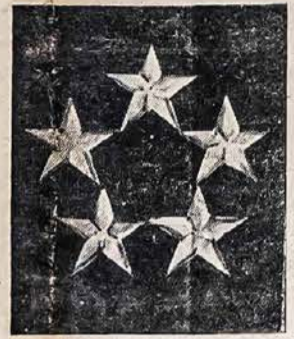
NAUJAS LAIPSNIS ĮKURTAS

Washington, D. C. — Čia yra paveiktas penkių žvaigždžių ženklė, kur bus nešiojamas ant armijos generolo peties, naujo laipsnio neseniai Kongreso įkurtas. Penkių žvaigždžių viduriniai punktai sudedami padaryti pentagoną. Vasaros laike, ženklas bus nešiojamas ant marškinėlių kalnierių. Generolai George C. Marshall, H. H. Arnold, Dwight D. Eisenhower ir Douglas MacArthur turi teisę nešioti penkis žvaigždes. Taipgi trys aukšti jurininkai turi teisę nešioti penkių žvaigždžių ženklą: admirolai King, Chester W. Nimitz ir William D. Leahy.