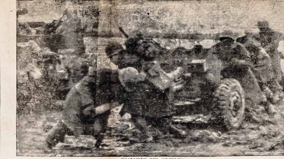
SMUGIS UŽ SMUGI. Prieš-tankinė patranka velkama į poziciją ant Vokietijos-Belgijos sienos atstumti smarkų vokiečių kontre-ataką ant pirmos armijos.