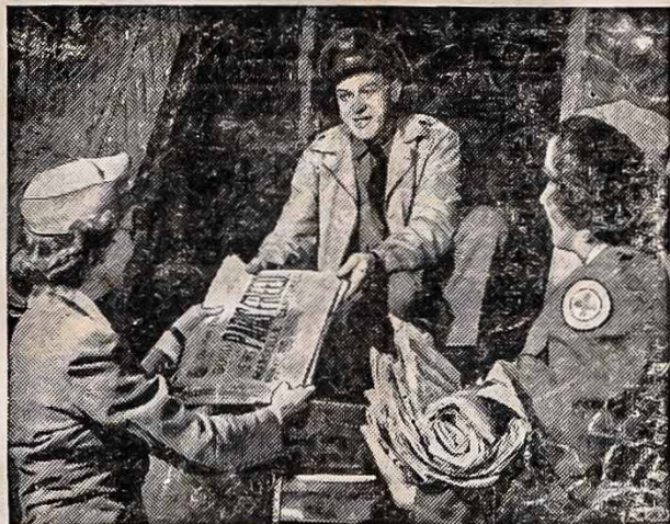
LAIKRAŠČIAI IŠ JUNGTTINIŲ VALSTIJŲ LĖKTUVAIS VEŽAMI KARIAMS LIGONINĖSE Į ALASKĄ

Jei kurioje šeimoje atsiranda narys, kurs pradėjas neišmintingai protauti, papildu kokį blogą akta, tada visa šeima delto jaučia ir kenčia negarbę. Todėl kiekviena šeima, pastebėjus, kad kuris nors jos narys krypta iš tiesos kelio, daro pastangas, jį ją perkabėti. Itikinti ir tuomi sulaikyti nuo iškrypimo. Kvailas bedieviškas protavimas privedė pasaulio žmonių prie kataklizmo, suirutės, kuriuomi yra šis baisusis, viską naikinantis karas. Bedievybė ir mums lietuviams nieko gero nedavė, tik pasėjo musų tarpe barnius, nesantaiką ir tuomi padarė mums daug žalos. Tad, kaip lietuvių tautinis šeimos narys, matydamas, kad musų tautoje pasireiskia iškrypimų iš tiesos, kurie mus tautai garbės nedaru, jaučiu reikalą ir pareigą nuo tų iškrypimų atkalbinti, pertikrinti, ir tuomi atgal sugražinti į išmintingo protavimo, ir veikimo stovį. Tą darydamas jaučiuosi atliekas vieną iš gailingųjų darbų, kur sakoma: "Nusidedančius ir nuo Dievo klystan-